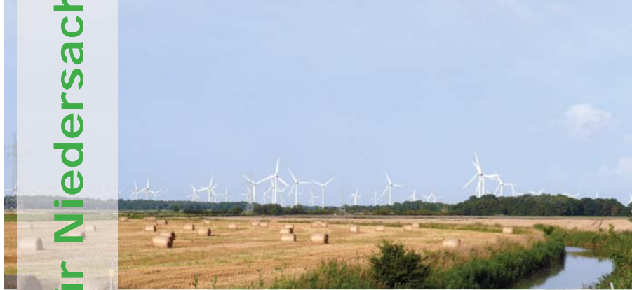
Flache Marschenlandschaft im nordwestlichen Niedersachsen