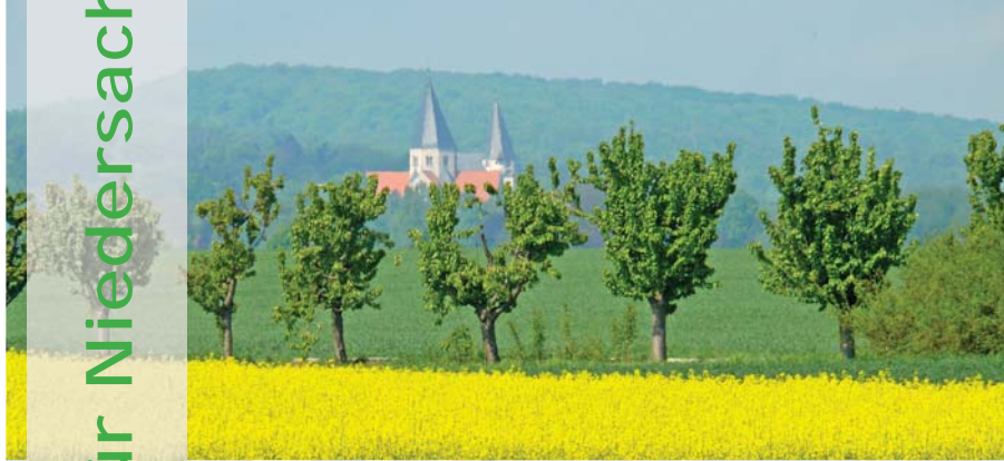
Fruchtbare Landschaft mit sanften Höhenzügen im östlichen Niedersachsen