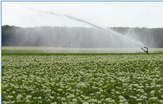
Feldberegnung in Niedersachsen; Quelle: LBEG

Dabei bilden Boden und Grundwasser unsere wichtigsten Lebensgrundlagen: Der Boden ist die Grundlage unserer Lebensmittelproduktion; vor allem aus dem Grundwasser wird unser Trinkwasser gewonnen. Somit bilden sie das Fundament unserer Infrastruktur und sind die Basis unserer modernen Gesellschaft.