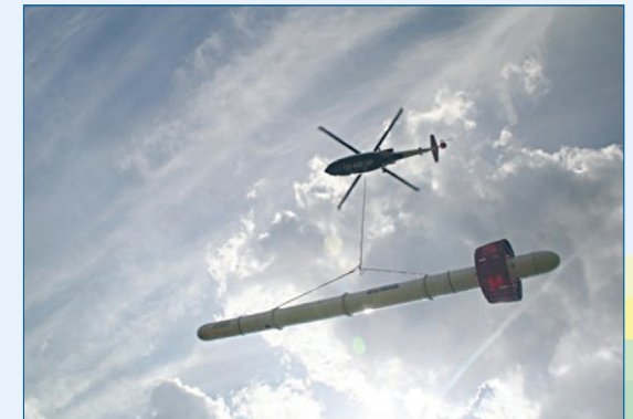
HEM-Messsystem der BGR

Mit dem Teilprojekt werden die Versalzung des Grundwassers und Möglichkeiten zur Grundwasserspeicherung im Elbe-Weser-Dreieck von Cuxhaven im Westen bis Stade im Osten untersucht. Durch den Einfluss der Nordsee ist das Grundwasser in den küstennahen Grundwasserleitern weitflächig versalzen. Durch hochstehendes Grundwasser ist der Flurabstand in den flachen Marschen sehr gering, so dass diese Bereiche kontinuierlich entwässert werden, um sie landwirtschaftlich nutzbar zu machen.