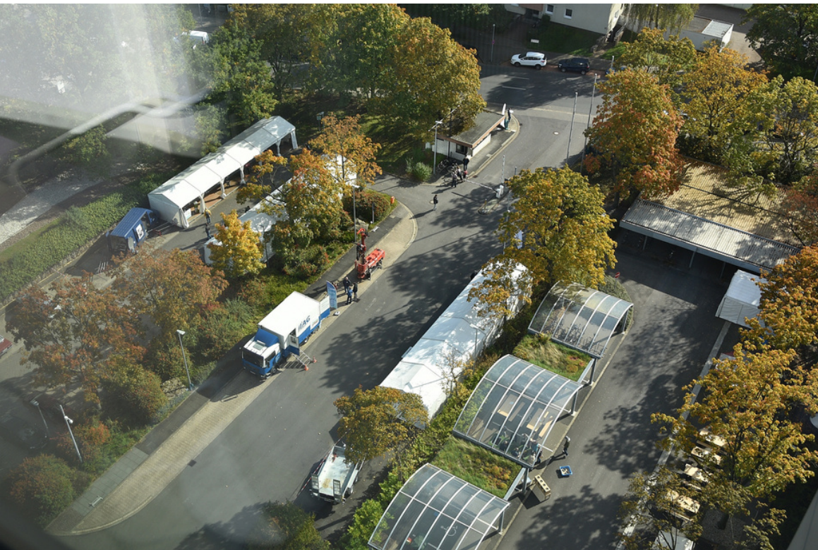
Ein Blick von oben auf das Ausstellungsgelände während des Aufbaus.