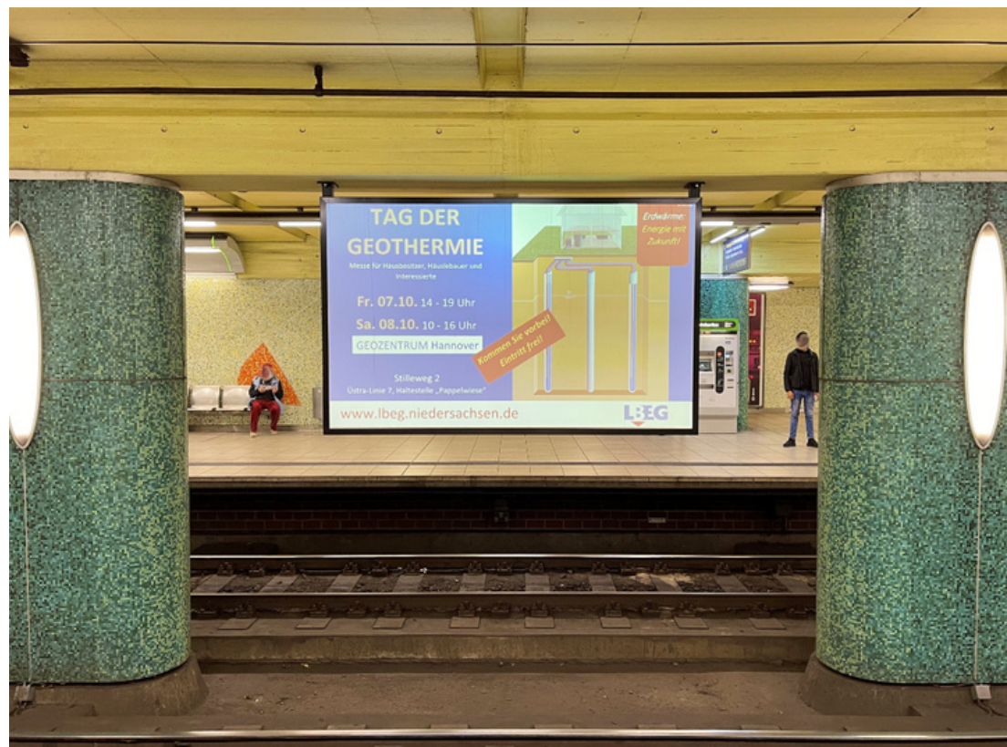
Die Veranstaltung wird beworben.