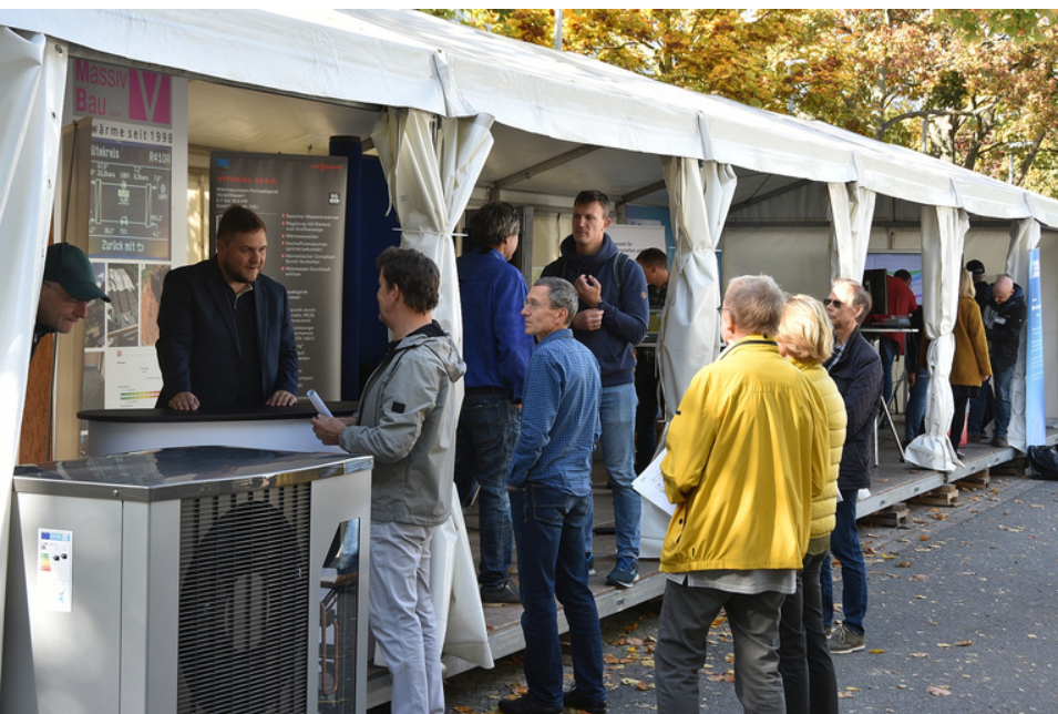
Die Zelte waren an beiden Tagen gut gefüllt.

Die KEAN, der Landesverband Erneuerbare Energien (LEE) und die Verbraucherzentrale nahmen als Aussteller teil.